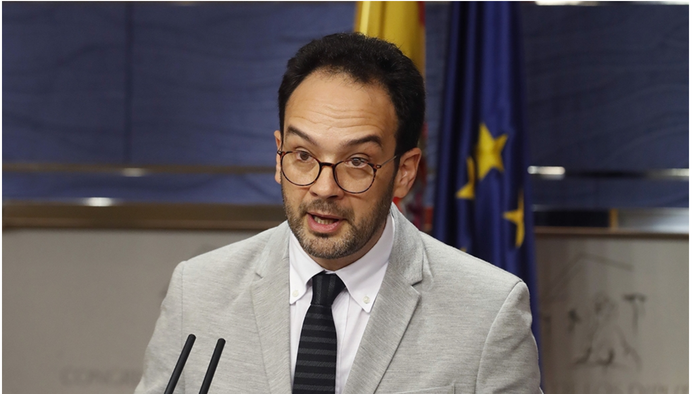
El portavoz del Grupo Socialista, Antonio Hernando, durante su comparecencia

MADRID / El Grupo Socialista votará en contra de que el Congreso otorgue a los diputados "la compatibilidad entre el ejercicio de una profesión o actividad remunerada y la representación de los ciudadanos", ha asegurado el portavoz socialista Antonio Hernando.