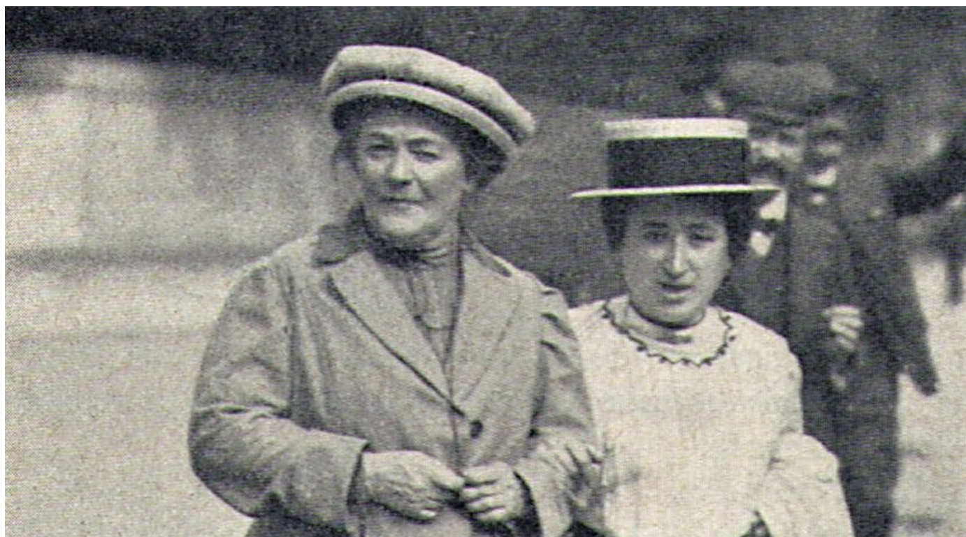
Clara Zetkin (izq.) y Rosa de Luxemburgo en 1910