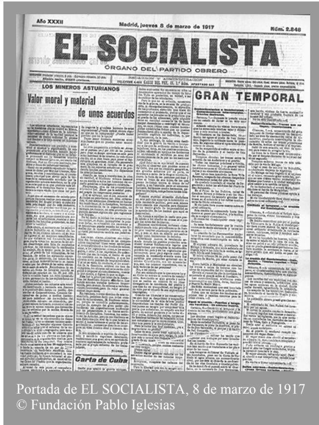
Portada de EL SOCIALISTA, 8 de marzo de 1917