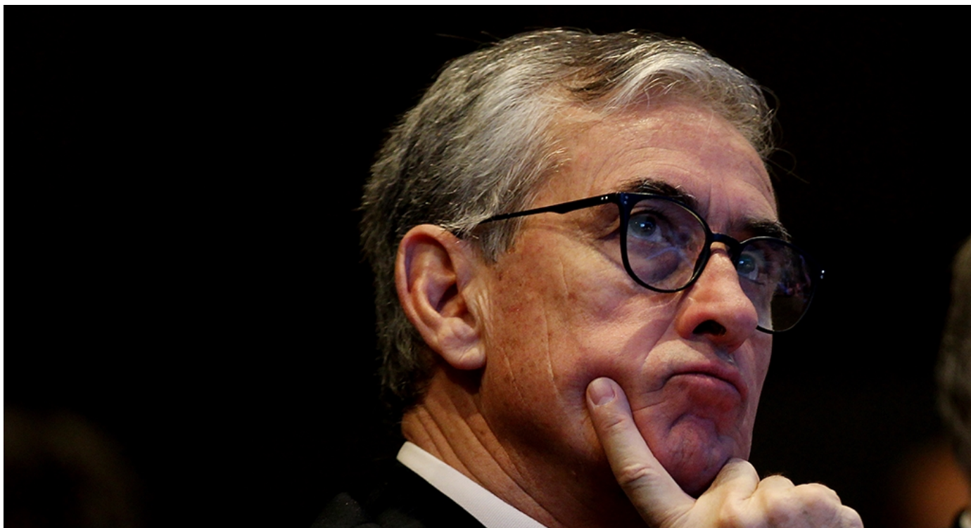
El eurodiputado español, Ramón Jáuregui