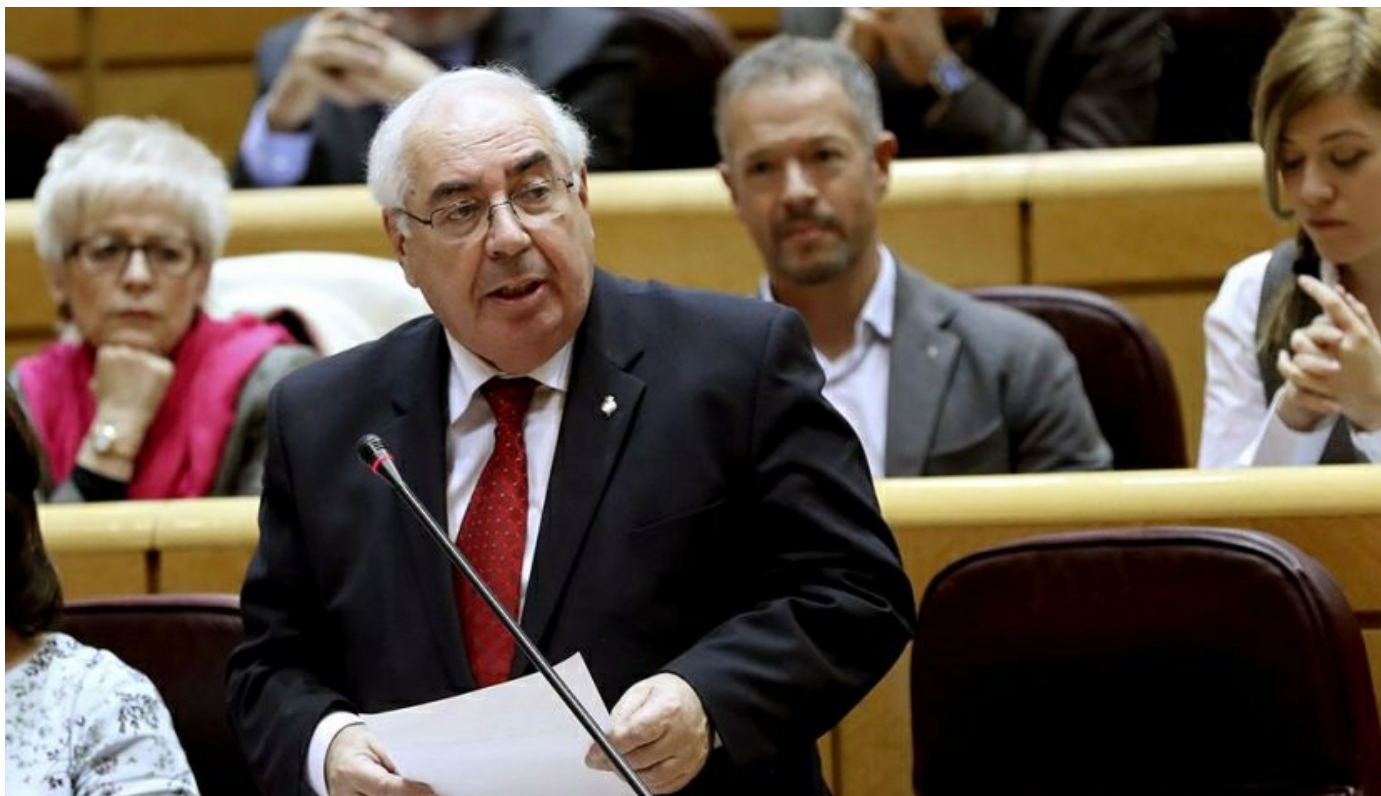
El portavoz del PSOE en el Senado, Vicente Álvarez Areces

MADRID / El portavoz del PSOE en el Senado, Vicente Álvarez Areces, ha propuesto en nombre del Partido Socialista, que el Gobierno acceda a un Pacto de Estado por los refugiados para que España pueda cumplir con sus compromisos de acogida adquiridos con la UE.